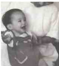
※写真は、ご本人が幼少時のものです。

ことにはないと知っています。力強く生きること苦難を乗り越えるしかないのです。このサリドマイドが、現在、再び認可され使われています。多発性骨髄腫という血液のがんやハンセン病の症状に効果があることが分かったためです。薬そのものが悪いのではない——二度と同じような被害を起こさないために、この薬の危険性をよく知って、慎重に使用してほしいと思います。